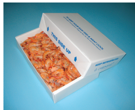
MC emballage er i gang med at lancere en særlig hygiejnisk og rengøringsvenlig fødevarekasse i bølgeplast

MC emballage er grundlagt i 1988 som et udbrud af S. Møller Christensen. I forbindelse med et generationsskifte i 2003, valgte virksomhedens ledelse en meget innovativ ejerstruktur, der betyder, at det i dag er medarbejderne, der ejer virksomheden.